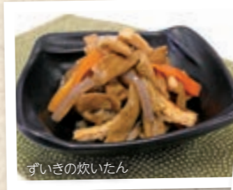
ずいきの炊いたん

『WaSaRa 近鉄あべのハルカス店』に続き関東初出店となる『WaSaRa そごう横浜店』では、京都のおばんざいとして受け継がれている「ずいきの炊いたん」や、人気の和え物に木の実を加え上品な味わいに仕上げた「さつまいもと根菜の木の实和え」など、新しい素材や味の調和にこだわった和惣菜をラインナップ。普段の食卓に新たなバリエーションとなる、ひとわざ効かせたこだわりの和サラダ・和惣菜で、より豊かな食生活を演出します。