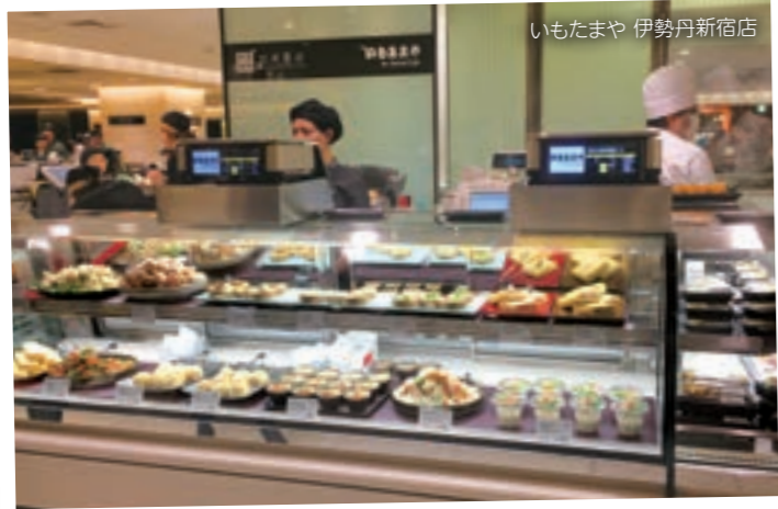
いもたまや 伊勢丹新宿店

Salad Cafeは、「じゃがいも」と「たまご」をメインにした和惣菜を提案する新ブランド『いもたまや』の展開を開始しました。