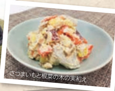
さつまいもと根菜の木の实和え