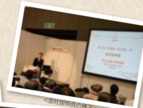
<会社説明会の様子>