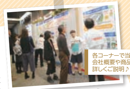
各コーナーで当社社員より会社概要や商品について詳しくご説明♪