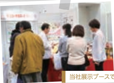
当社展示ブースの様子