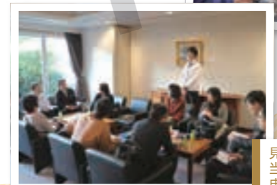
見学会終了後、別室にて当社役員よりご挨拶を申し上げます。