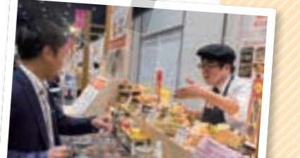
会場では、商品を使ったメニューの試食をたくさんしていただきました!