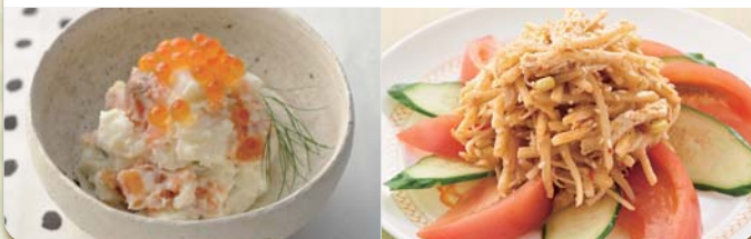
ロングライフサラダ

長期間保存可能なサラダ「ロングライフサラダ」は、業界のバイオニアであり、発売当時からトップシェアを堅持。「FDF(ファッションデリカフーズ)」のブランドで、外食産業や製パン、コンビニエンスストア等で使用されている。