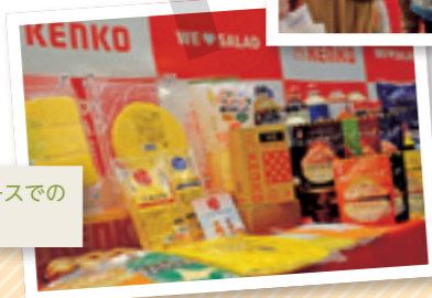
当社展示ブースでの商品展示