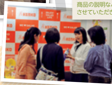
当社社員より商品の説明などをさせていただきました