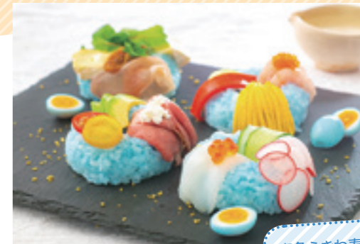
青色うきわ寿司 with たまごピクルス

7月に発売した「ノンオイルドレッシング オーシャンブルー™」はインスタ映えを意識した商品で、スーパーフードの一種であるスピルリナ由来の天然色素を使用した鮮やかな青色が特長です。味は見た目からは想像できない爽やかなグレープフルーツ味です。発売直後にテレビやネットニュースで取り上げられ、話題を集めています。おかげさまでレストランのサラダバーやコラボカフェなど多くの店舗、食シーンでお使いいただいております。今後もますます導入が期待される商品です!