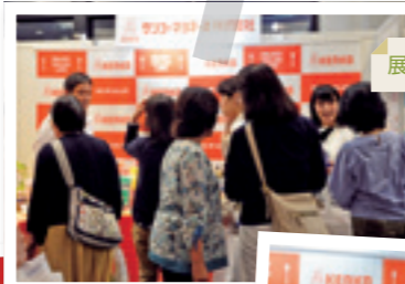
展示ブースの様子