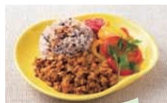
やさいと大豆ミートのキーマカレープレート

健康志向の高まりや多様化する食の嗜好、外国人のニーズに応え、大豆ミート*をベースとして肉を使わずに仕上げた商品シリーズです。本物の肉の味わいや食感に近づくよう、調味などの加工面で、何度も試行錯誤を行いました。