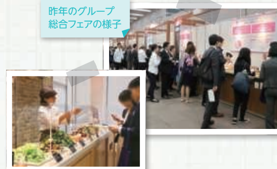
昨年のグループ総合フェアの様子