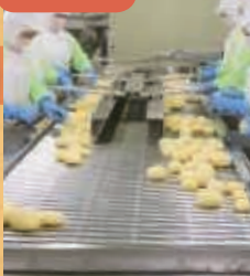
皮むき後の芽取りの様子