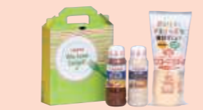
▲当社製品1,000円相当(製品例)