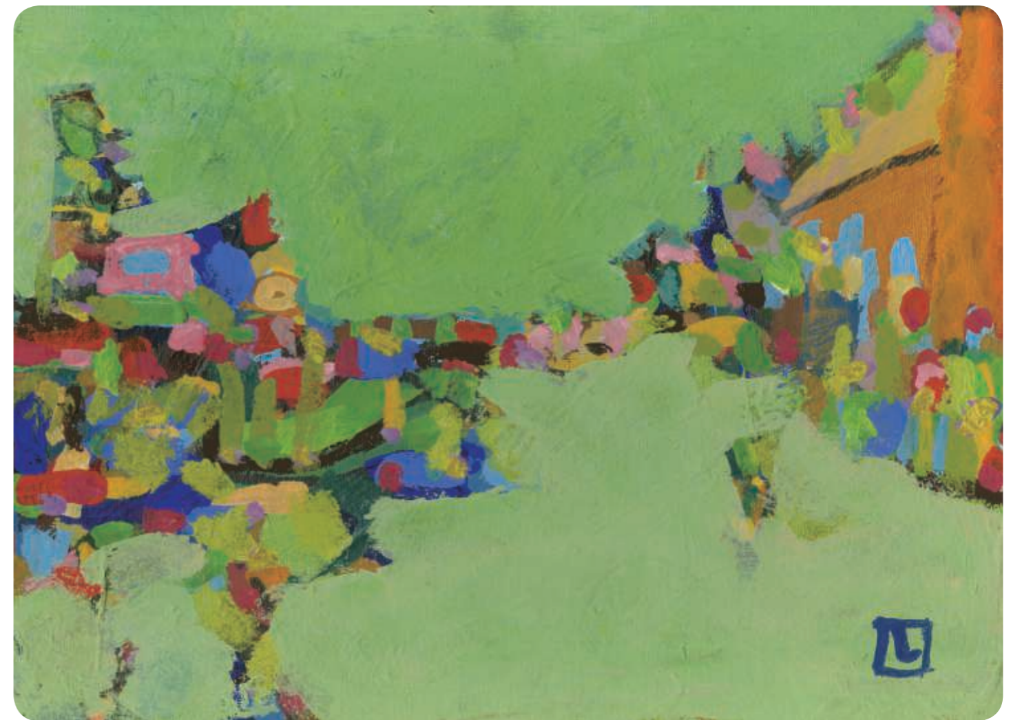
障がい者アーティスト 丹野 滋生氏/作 作品名「希望」