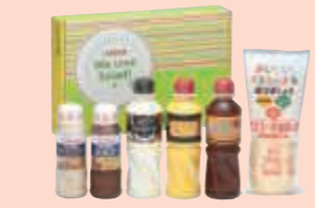
▲当社製品2,500円相当(製品例)