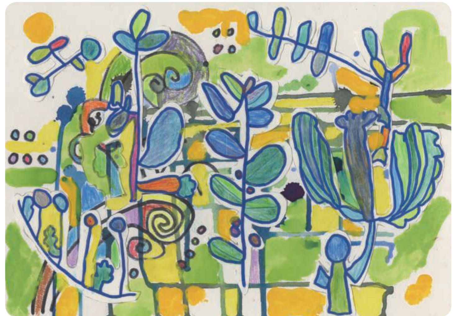
障がい者アーティスト 丹野 滋生氏/作 作品名「シンフォニー」