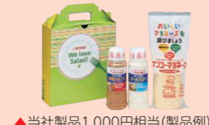
▲当社製品1,000円相当(製品例)