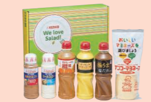
▲当社製品2,500円相当(製品例)