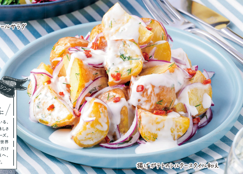
揚げポテトのシルタースタイル和え