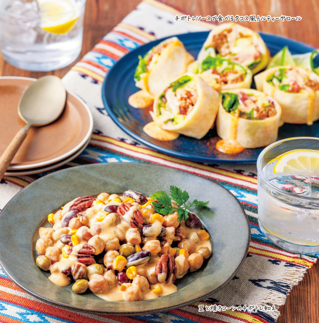
豆と焼きコーンの4ポトレソース