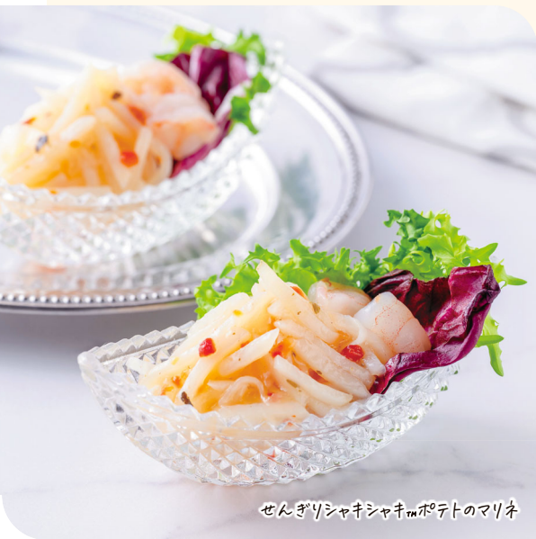
せんぎりシャキシャキポテトのマリネ