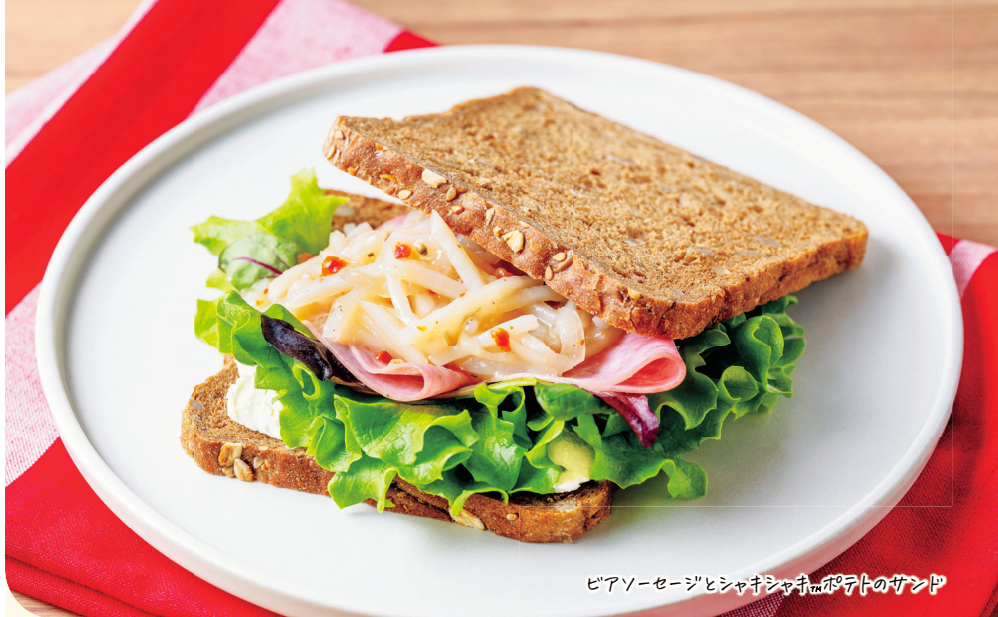
ピアソーセージとシャキシャキポテトのサンド