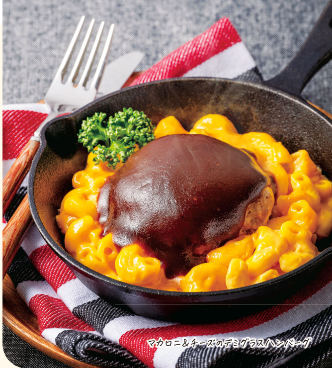
マカロニ&チーズのデミグラスハンバーグ