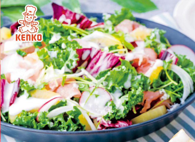
生ハムとキウイのケールサラダ シルタースタイル