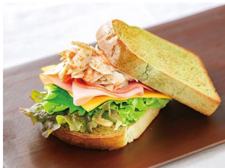
金ごまごぼうと2種ハムのお野菜パンサンド