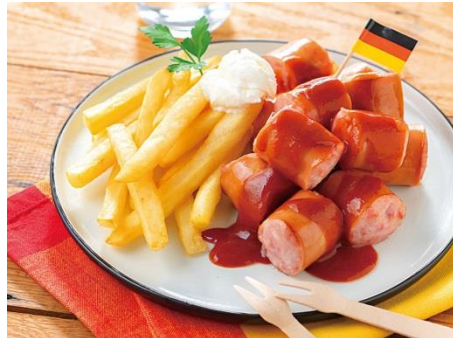
ドイツ名物！カレーヴルスト