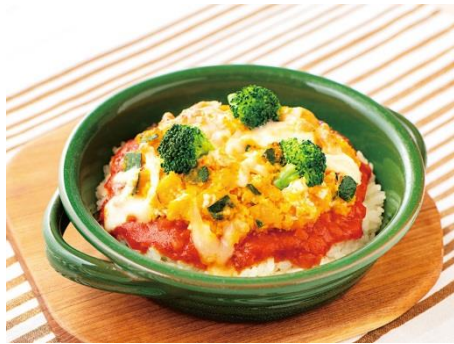
パンプキンミートドリア