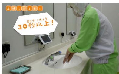
▲工場に入るまでの衛生ポイント