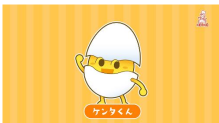
▲たまごの PR キャラクター「ケンタくん」