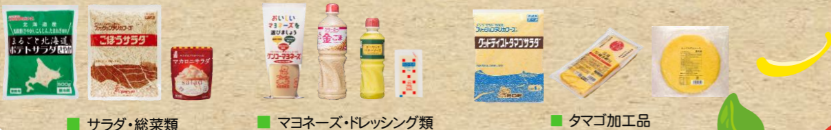
■ サラダ・総菜類 ■ マヨネーズ・ドレッシング類 ■ タマゴ加工品